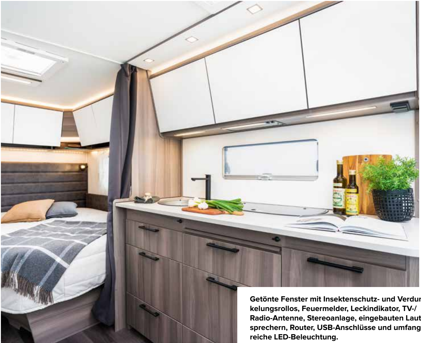
Getönte Fenster mit Insektenschutz- und Verdunkelungsrollos, Feuermelder, Leckindikator, TV-/Radio-Antenne, Stereoanlage, eingebauten Lautsprechern, Router, USB-Anschlüsse und umfangreiche LED-Beleuchtung.

„Das Innendesign ist von einer einfachen und stilreinen Formsprache geprägt. Die Inspiration fanden wir in den funktionellen Küchen der 1950er Jahre mit ihren abgewinkelten Oberschrank-Schiebetüren. Dieses Design zieht sich wie ein roter Faden durch den gesamten Wohnwagen, mit geraden Oberschränken in der Küche, die in einer Linie mit den Oberschränken über der Sitzgruppe und im Schlafbereich liegen“, sagt Tina Andersson.