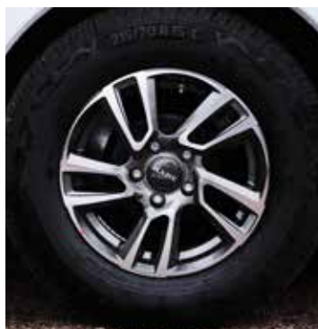
Neue, elegante 15-Zoll-Felgen.