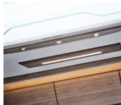
Deckenlampe und Beleuchtungsträger in neuem Design.